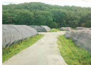
除染のため削り取った土砂等の仮置場(飯館村)。平成26年9月福島県は大熊町・双葉町への中間貯蔵施設受入れを容認(2014年8月撮影)