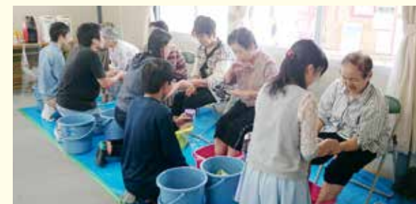
いわき市内の泉玉露仮設住宅での足湯(2014年9月)

震災から4年が経過し震災に関する話題は少しずつ減ってきていますが、まだ被災者の方々の心には震災の爪痕が残っています。このボランティアではそんな被災者の方々が抱えた思いを吐き出す機会となることを目的としています。参加者からは「実際に被災地の方と話すことができ貴重な体験だった」との声がありました。