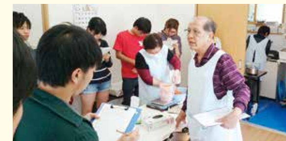
川内村の食品検査場を訪問(2014年9月)

原発事故があった福島県は、他の地域とは異なった問題を抱えています。スタディツアーは、そうした状況を深く理解するために実施しています。2014年度は、東京から来た学生とともに川内村の食品検査場や、福島市内のお米の全量全袋検査会場や果樹園を訪問し、風評被害について学ぶツアーを行いました。またいわき市で津波被災の状況を視察したり、郡山市内にある「富岡町おだがいさまセンター」で事故発生当時の状況や現在の課題についてお話をうかがうこともあります。福島県内でも被害状況や線量の違いで状況が異なり、それぞれの復興の課題と必要な取り組みを学んでいます。