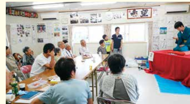
仮設住宅で落語を披露する東北大学生

女性は手芸の折り紙やぬいぐるみ作りをされる方が多く、その一方で、男性は将棋やオセロなどのボードゲームをする傾向があり、一つの空間の中でバラエティーに富んだ交流をしています。最近ではカラオケを導入したこともあり、集会所はさらに賑やかになりました。学友会落語研究会の方に、落語をしてもらうこともあります。帰り際に住民の方が言ってくれる「楽しかったよ。また来てね」の一言が、「また来よう」と思わせてくれるモチベーションです。この活動で被災地の方々が1日も早く元気になることを願っています。