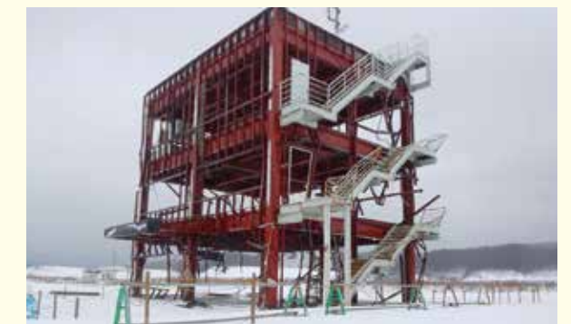
保存が取り壊しか。議論の続く南三陸町防災庁舎(2014年2月撮影)

壊滅的な被害を受けた志津川地区にある防災庁舎、震災遺構として保存するかどうか議論されています。宮城県からは、県が管理して残す案も示されています。東北大学の団体では「All4Tohoku」が小学生向けのフットサル大会を開催しています。また、「復興応援団」は地元の農業・漁業を応援するツアーを開催。リピーターを多数呼び込み、地域の課題と魅力を伝えています。