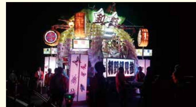
8月7日の動く七夕。電飾された山車をひっぱる

仮設住宅や復興住宅以外の陸前高田市の地域社会も、被災で大きなダメージを受けました。そうした地域で、一時は途絶えてしまった子ども会の支援として、小中学生を対象としたレクリエーションや学習支援の開催をしました。また、毎年8月7日には震災前からの陸前高田市伝統のお祭り「うごく七夕」において「よいよい」と声を合わせ、地域の方々と山車を引いて市内を周り、1月には「しまい」の獅子の代わりに虎を被って地域の家の悪魔祓いをする「とらまい」で、虎や踊り子として学生が参加しお手伝いします。震災の影響や高齢化により、こうした地域行事の存続も難しくなっているのです。また専門家の先生をお招きした防災に関するワークショップの実施等を通じて、復興まちづくりについても住民と一緒に考えています。