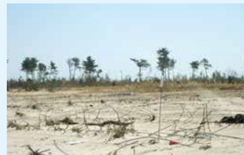
2011年4月 山元町

仙台市内の仮設住宅では様々な団体が学習支援を行っています。被災により学校が休校になり、勉強が遅れてしまったことがきっかけでした。その後も環境の変化に直面する子供たちを支えています。