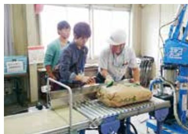
福島県産のお米は全量全袋検査され安全性が確認された上で出荷されているが風評被害に苦しんでいる(2014年9月撮影)

学生ボランティア支援室では、2013年から福島県でのスタディツアーの実施や、仮設住宅や復興住宅での足湯や手芸の活動や清掃ボランティア、子育て支援への参加、避難指示が解除された地域での復興支援活動などを行ってきました。