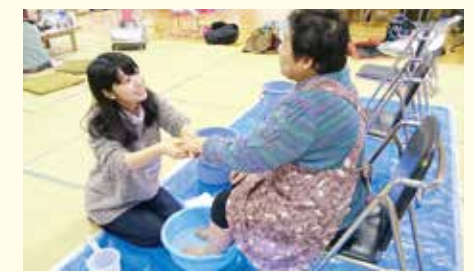
2014年2月 雄勝町での足湯ボランティア活動