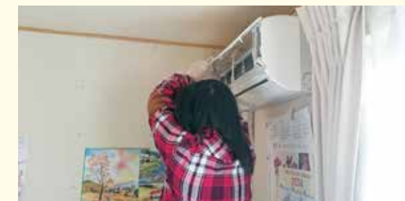
仮設住宅内のエアコンのフィルター清掃(2014年12月)

震災からまもなく4年を迎える中、仮設住宅の老朽化や汚れが目立つようになってきています。そこで東北大学では「NPO法人コースター」のご協力により、郡山市内で川内村の方が入居する仮設住宅のお掃除をするボランティアを夏休みと年末の2回行いました。あらかじめ掃除をしてほしいというご依頼があった方のお部屋に4人ほどで入らせていただき、エアコンのフィルターや換気扇など、普段はなかなか手の届かないところを掃除していきます。掃除が終わった後、入居者の方から様々なお話をうかがうこともでき、その点でも非常に勉強になる活動です。