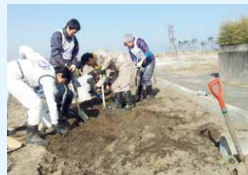
2013年2月 若林区でのReRootsの活動

震災からの4年間で、大学生によりあるいは社会人により様々なボランティア活動が行われました。役割を終えた活動もあれば、5年目の今だからこそ必要になる活動もあります。宮城県内で東北大生ボランティアが活動した地域をいくつかとりあげ、そこでの活動のあゆみを振り返ります。