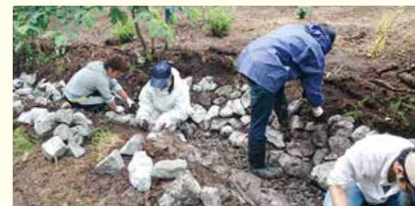
田村市都路地区での小川の整備作業(2014年7月)

福島県田村市都路地区では、2014年4月1日に避難指示が解除され、帰村が進みつつありますが、人口流失による過疎・高齢化に悩まされています。この地域復興を目的とした活動を現地の「復興応援隊」のアレンジで7月と11月の2回行いました。7月には帰村した後、3年間の留守の間に荒れてしまった庭を整備し地域の魅力にする活動で、庭を流れる川の整備(石積み)を行いました。11月には学生の視点から都路の魅力を探るため、応援隊の方の案内で、自然豊かな都路を散策し、住民の方々の話をうかがいました。その後、みんなで地域資源を生かしたまちおこしの方法について白熱した議論をしました。