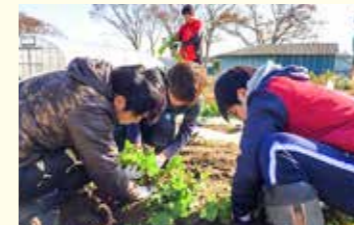
2016年11月みまもり隊の農作業

学生団体の「みまもり隊」は2011年から東松島の農家の支援に着手、現在の活動のメインは、地元の方々とともに「東松島地野菜プロジェクト」です。東松島ならではの野菜を生み出すことで、人が戻ってこられる場所を作ろうとしています。他には、地域のお祭りに出店したり、イベントの手伝いを通して地元の方と関わり、ともに楽しみながら活動しています。