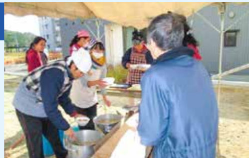
2016年11月ReRoots「食のサロン」の様子

なお2016年度からは、太白区あすと長町地区の災害公営住宅において、基礎ゼミ・展開ゼミ継続サークル「たなぼた」による活動もスタートしました。この住宅では、各地から多様な人が入居していることから、顔見知り関係の創出を目的として、カフェ活動の企画・参加を行っています。